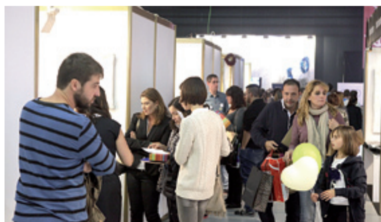
La feria contó con una gran animación a última hora de la tarde. M. GARCÍA

>Los desfiles y el showcooking fueron las actividades con más público