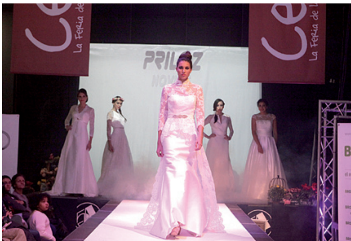
Uno de los desfiles de novias que se pudo ver ayer en la pasarela de Celebra. MIGUEL GARCÍA

En el puesto que tienen instalado en el Palacio de Congresos también dan a conocer los productos solidarios que hacen en los dife-